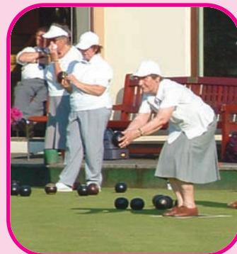
Tudalen 5 Ymarfer Corff a Chadw'n Heini