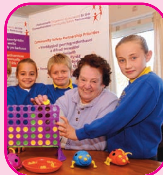
Tudalen 5 Gwaith rhwng Cenedlaethau

Argraffwyd ar bapur mae 100% ohono wedi'i ailgylchu.