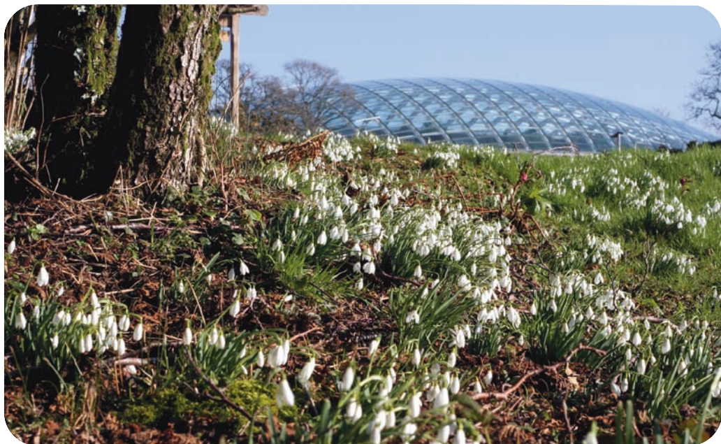
Lili wen fach yng Ngardd Fotaneg Genedlaethol Cymru.

Croeso i rifyn cyntaf 2009. Mae llawer wedi digwydd ers i'r ail rifyn gael ei gyhoeddi yn yr hydref.