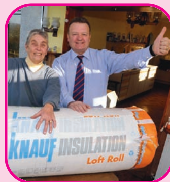
Tudalen 4 Gwasanaeth Ynni Cartref