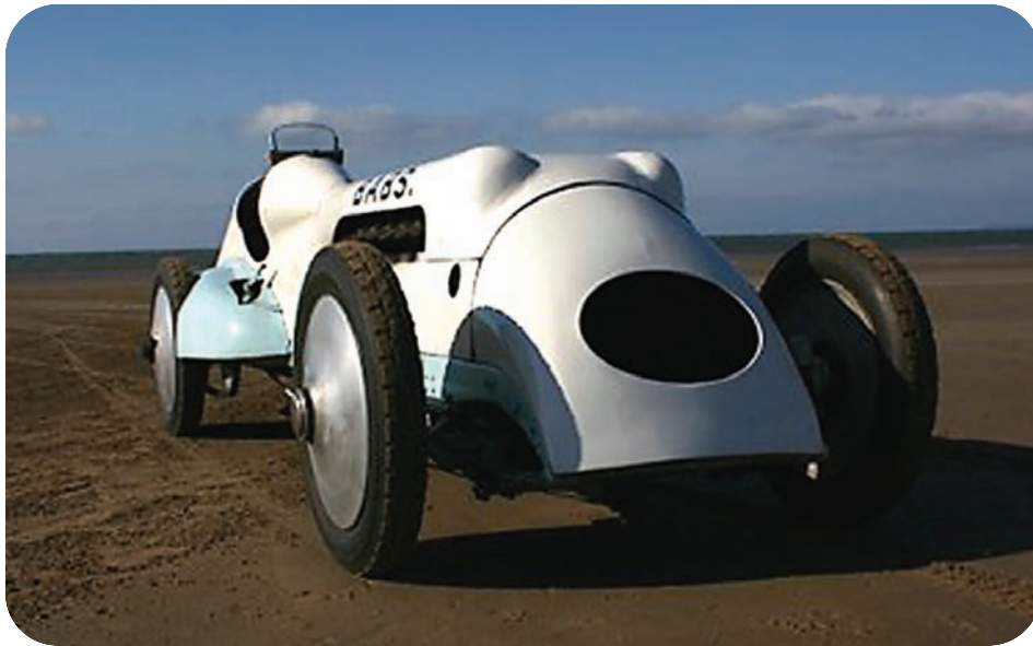
'Babs', arddangosfa yn yr Amgueddfa Cyflymdra, ar draeth Pentywyn

Mae canlyniadau'r Arolwg 50+ diwethaf yn cael eu defnyddio i helpu gwella'r gwasanaethau a ddarperir gan lyfrgelloedd ac amgueddfeydd Sir Gaerfyrddin.